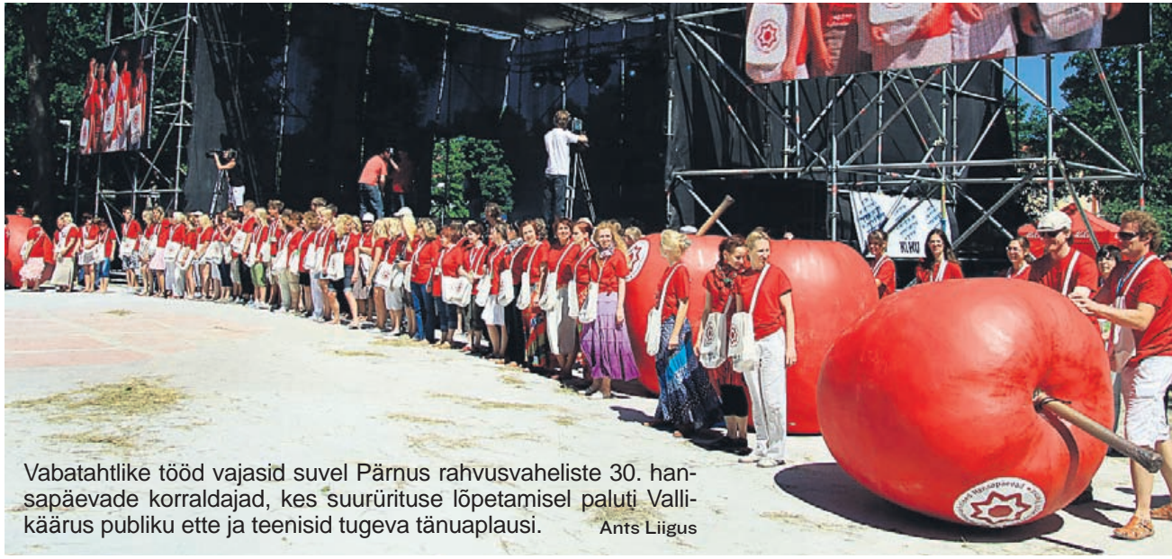
Vabatahtlike tööd vajasid suvel Pärnus rahvusvaheliste 30. hantsapäevade korraldajad, kes suurirituse lõpetamisel paluti Vallikäärus publiku ette ja teenisid tugeva tänuaplauusi. Ants Liigus